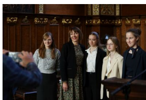
Finał 50. Olimpiady Historycznej – Gdańsk, 14 kwietnia 2024.