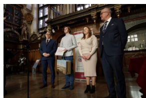
Finał 50. Olimpiady Historycznej – Gdańsk, 14 kwietnia 2024.

Warto podkreślić, że wielu uczniów biorących udział w Olimpiadzie z czasem dołącza do elity intelektualnej Polski – spośród olimpijczyków wywodzi się znaczny procent pracowników naukowych historii uczelni wyższych. Jest to jedno z najważniejszych wydarzeń historycznych organizowanych na terenie naszego kraju.